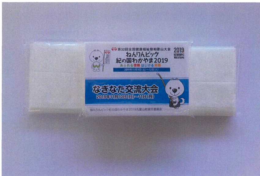
ポケットティッシュ（啓発物品）