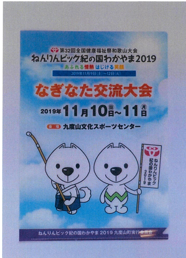
クリアファイル (啓発物品)