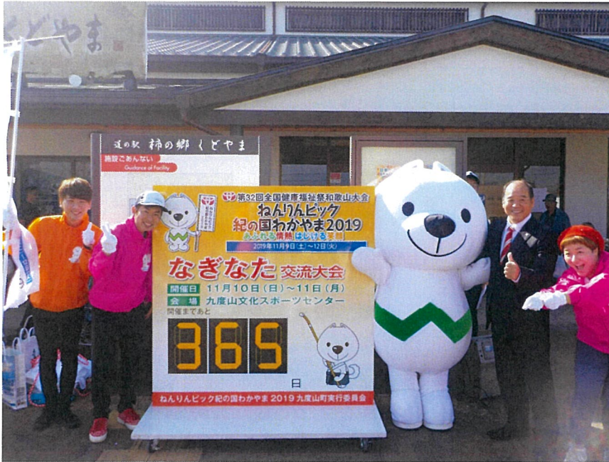
カウンタダウンボード（道の駅）