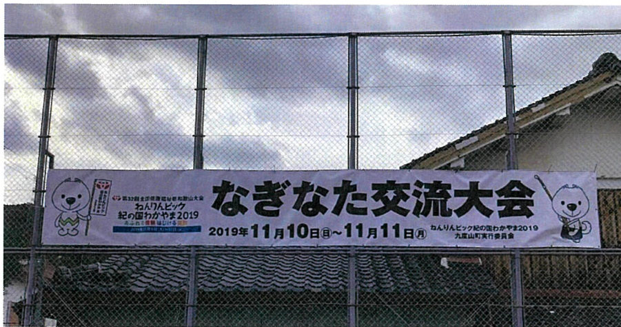
横断幕（スポセン前）