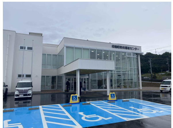
▲ 印南町防災福祉センター（11月9～10日視察）

次回、定例会は3月に予定されています。 日程が決まり次第、ホームページに掲示します。 https://www.town.kudoyama.wakayama.jp/