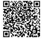
九度山町議会ホームページQRコード

TEL 54-2019(代表) FAX 54-4705(直通) mail gikai@town.kudoyama.lg.jp