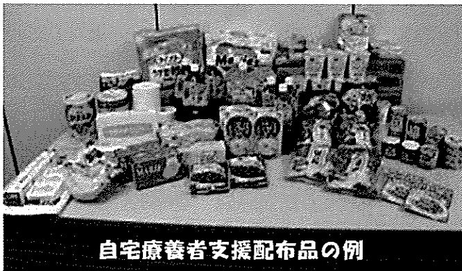
自宅療養者支援配布品の例

住民課長 県の方針に従って町は対応していくこととなります。生活支援が必要なケースが出てきた場合には、保健所からの要請をもとに個々に対応していきたいと考えています。