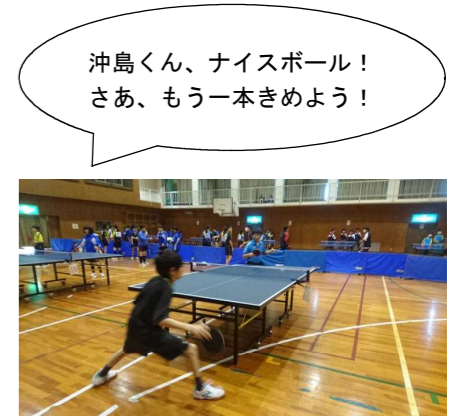
沖島くん、ナイスボール！さあ、もう一本きめよう！