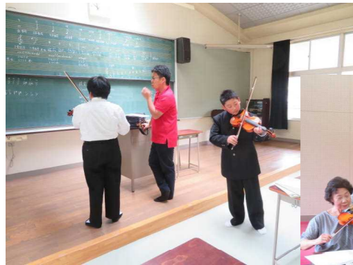
ヴァイオリンの練習の様子です。

植えた野菜は、児童生徒たちで水やり当番を決め、世話をしています。夏に向かって野菜が育っていくのが楽しみです。