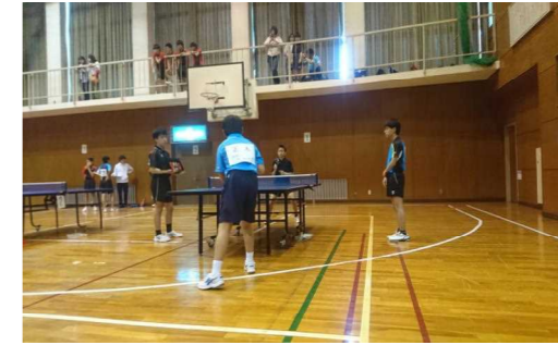
正木くんがこれからサーブを打ちます。