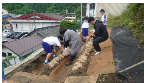
河根農園に夏野菜を植えました。