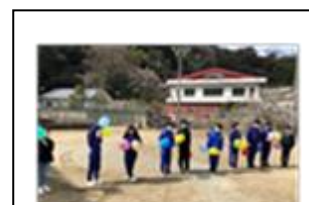
[バルーンフェスタ]