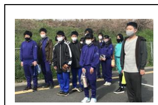
[お別れ遠足（隠れ谷池にて）]