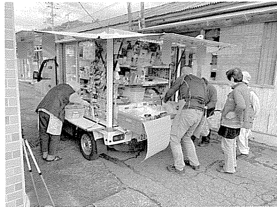
「移動スーパー とくし丸」

販売場所や時間等の詳細については、社協広報誌「社協 くどやま」9月号に掲載していますので、ご確認ください。また、販売地域についてのご要望等がございましたら、下記までお問い合わせください。