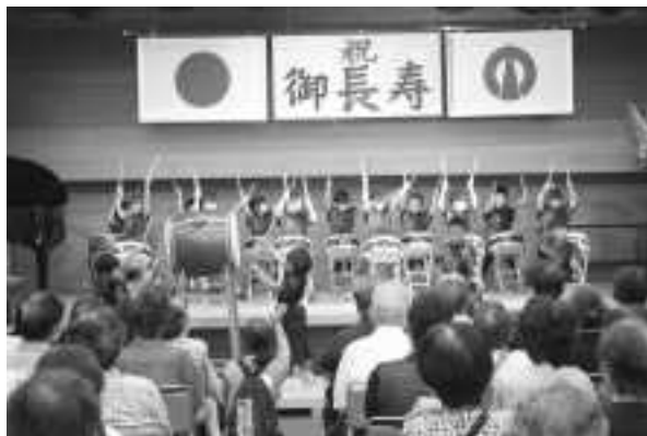
▲九度山保育所の子どもたちによる和太鼓の演奏

なお、9月1日現在、町内には75歳以上の方は1073名おられ、そのうち80歳以上の方は、732名おられます。皆さまのご長寿をお祝い申し上げます。