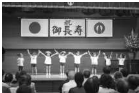
▲九度山幼稚園の子どもたちによる歌の披露