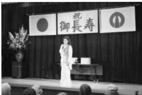
▲りょうさんのものまねショー