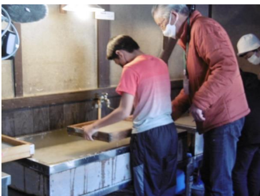
6年 卒業証書の紙すき