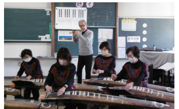
保護者学級 尺八と琴体験