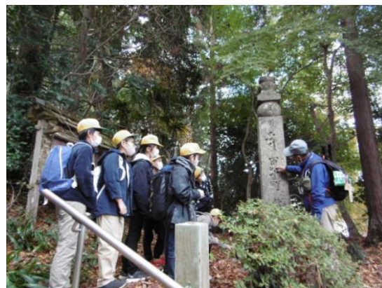
次世代育成事業 町石道 慈尊院～丹生都比売神社