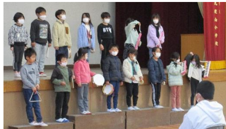
【1年生 合奏 きらきらぼし】