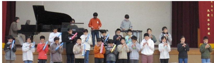
【6年生 合奏 生命のいぶき】