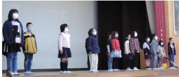
【2年生 合唱 スマイルアゲイン】