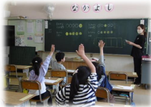
1年生 学校生活にも慣れてきました。

5月5日、好天に恵まれ、高学年児童が九度山町を代表する祭りである「紀州九度山真田まつり」の武者行列に参加しました。100年近く続く町の伝統行事に参加することは、本校の教育目標である「学校や地域に誇りをもつ児童の育成」にもつながり、子どもたちにとって大変有意義な体験です。子どもたちの凛とした姿がとても素敵でした。保護者の皆様には、着付け等多大なるご協力をいただき、ありがとうございました。