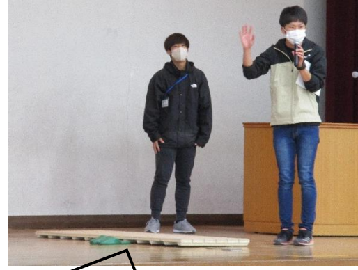
児童会 あいさつ運動 「今年は毎朝やります」