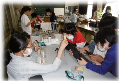
6年生 理科の実験の様子をタブレットで記録しました。体育で楽しく運動しています。