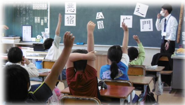
4年生 同じ部首の漢字を見つける学習をしました。