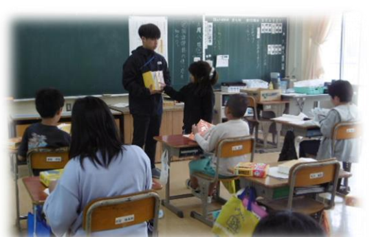
3年生 国語辞典の使い方を学習しました。