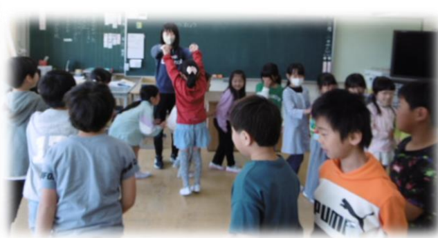
2年生 音楽で「ロンドン橋」を歌いながら活動しました。