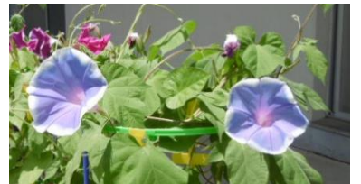
朝顔が満開です(1年生)