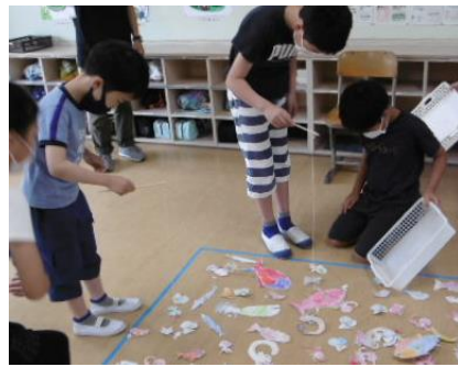
(3年生)魚つり・宝さがし