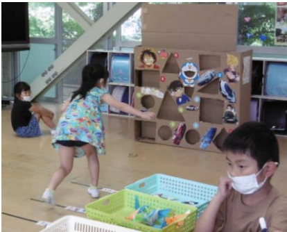
(2年生)ドラえもんフリスビー

終わった後、児童会の人々が1年生にインタビューをすると、「〇〇がとっても楽しかった」とそれぞれみんなの前でうれしそうに答えていました。そんな1年生の笑顔を見て、他の学年の児童たちもとてもいい表情をしていました。