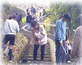
全校 ボランティア活動 落ち葉清掃