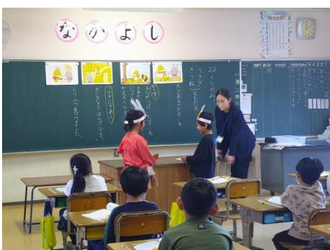
授業参観 道徳の学習（1年生）

最後に、今年も学校教育振興にご支援・ご協力いただきありがとうございました。来年も引き続きご支援いただきますよう、よろしくお願い申し上げます。よいお年をお迎えください。