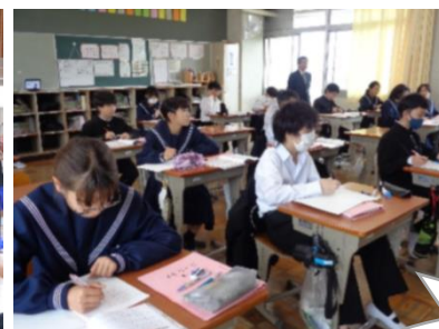
授業や県学習到達度調査、がんばってます☆