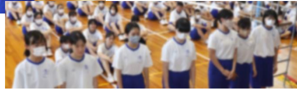
試合の様子を 実況中継