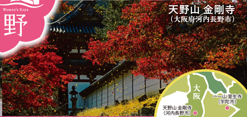
天野山 金剛寺 (大阪府河内長野市)