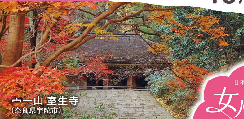
一山 室生寺 (奈良県宇陀市)