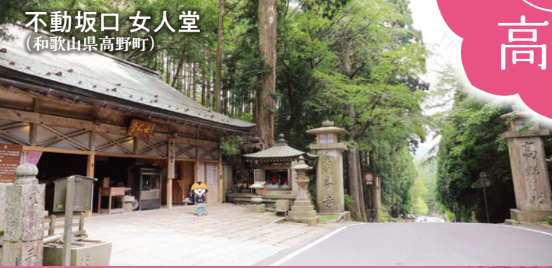
不動坂口 女人堂 (和歌山県高野町)