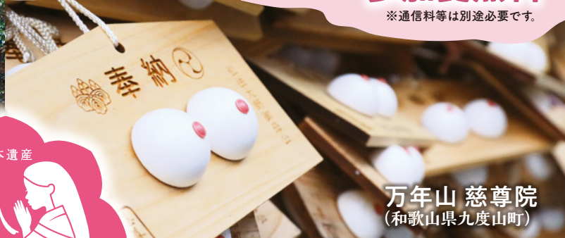
万年山 慈尊院 (和歌山県九度山町)