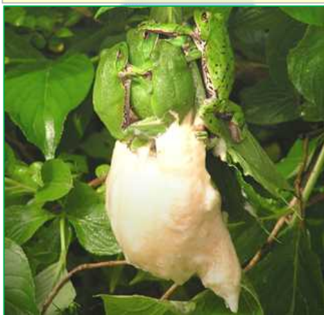
樹上のモリアオガエルと卵塊の写真